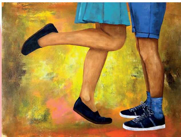
Skupaj, akril na platnu, 2018

Razstava bo na ogled do 12. februarja 2026.