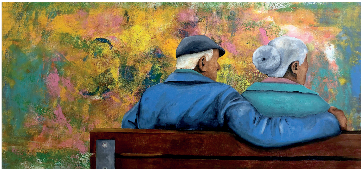
Na klopci, akril na platnu, 2018